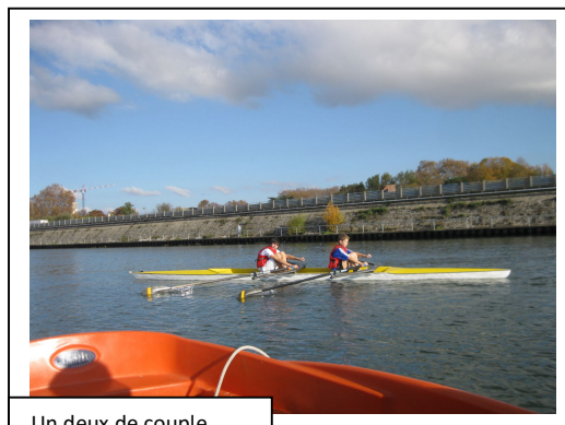
Un deux de couple

L'initiation en bateaux se fera à partir du ponton. L'initiation à l'ergomètre aura lieu dans les locaux du club. (voir plan de situation en page 4)